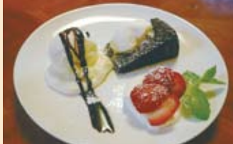
◎ガトーショコラのアイス添え.....450円