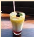
◎三毛猫ドリンク .....450円