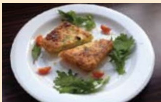
◎七つの野菜のキッシュ.....450円