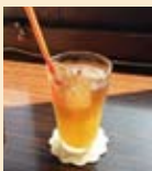
◎トラ猫ドリンク .....450円